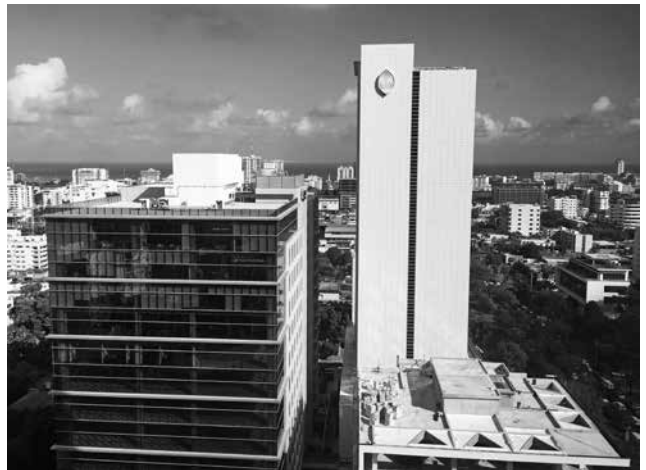
経済発展が著しいサントドミンゴ新市街

サントドミンゴ市に限らず、他のラテンアメリカ諸国や「開発途上国」、「新興国」と言われる国々の首都・大都市は、少なくとも表面上は先進国と遜色ない形で最新テクノロジーやトレンドを導入し、それらが市民生活に大きな影響と変化を与えている。今後サントドミンゴ市がどの様に変化・発展してゆくのか、注意深くフォローしてゆきたい。