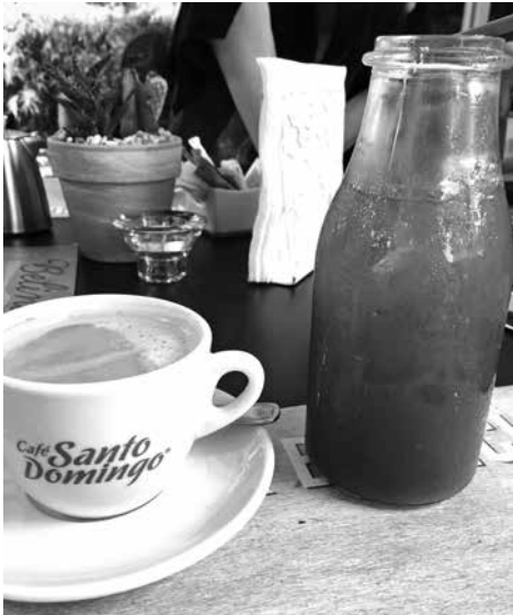
ドミニカン「青汁」をカフェ・サントドミンゴとともに頂く

自動車についても、富裕層はガソリンを大量消費する車高の高い大型のジープを好む傾向があったが、近年小型車を所有する富裕層も出て来た。市内渋滞時の移動を考慮し、小型車を運転する傾向になって来ている一方、環境に配慮する考えも出てきている。